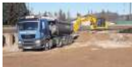
Baustellenverkehr mit Kipper