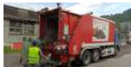
Abfuhr von Hausmüll und Biomüll aus Haushalten